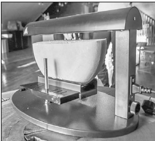
Grilēto sieru tradicionāli ēd kopā ar vāriem kartupeļiem, dārzeņiem, marinējumiem — uzliek kausēta siera staipīgo kārtu.